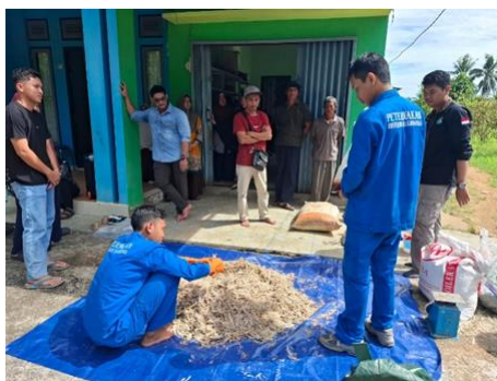
Gambar 4. Bahan siap di kemas dan fermentasi

Pertanyaan manfaat utama bokashi bulu ayam yang ditanyakan pada pre test dan post test dengan mayoritas jawaban Adalah untuk mengurai limbah dan menghasilkan pupuk organik, hal ini berarti peserta sejak awal sudah memahami manfaat pembuatan bokashi. Hal ini sesuai dengan tujuan pengolahan limbah bulu ayam, yaitu mengurangi akumulasi limbah dan menghasilkan pupuk organik berkualitas (Yuliani & Hartati, 2025).