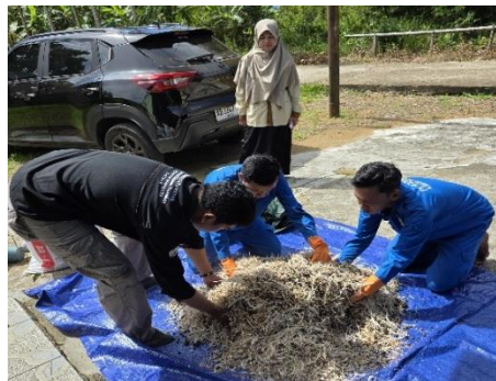
Gambar 3. Proses pencampuran bahan.

Proses fermentasi anaerob terbatas pada bokashi menjaga sebagian besar karbon organik tetap tersimpan dalam bahan padat dan menurunkan pelepasan gas seperti N_2O dan CH_4 (Gebiola et al., 2023). Hal ini membuat bokashi lebih ramah lingkungan dibandingkan pengomposan aerobik tradisional (Lavagi et al., 2024). Penggunaan EM4 dalam fermentasi bokashi menumbuhkan populasi bakteri asam laktat, actinomycetes, dan ragi yang membantu dekomposisi sekaligus menekan pertumbuhan mikroba patogen (Tomczyk et al., 2023). Dengan demikian, produk bokashi lebih higienis dan aman diaplikasikan ke lahan pertanian (Zhang et al., 2024). Bokashi dapat difermentasi dalam waktu relatif singkat, sekitar 7–14 hari, sehingga lebih cepat tersedia dibandingkan kompos konvensional yang memerlukan waktu berbulan-bulan (Erdal, 2025). Produk yang dihasilkan juga lebih stabil dan homogen sehingga memudahkan aplikasi di lahan (Lavagi et al., 2024). Selama fermentasi, terbentuk asam organik dan senyawa lain yang membantu mengikat nutrisi sehingga tidak mudah tercuci saat diaplikasikan ke tanah (Zhang et al., 2024). Hasilnya, bokashi meningkatkan kapasitas tukar kation, retensi air, dan kesuburan tanah secara keseluruhan (Tomczyk et al., 2023).