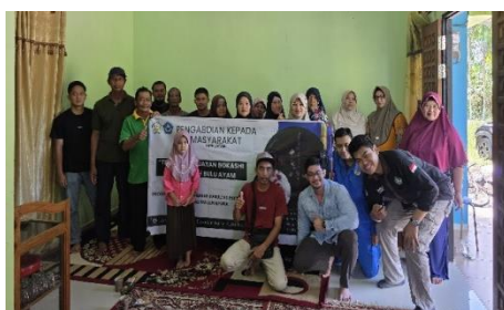
Gambar 5. Peserta kegiatan PKM.

Hal yang menjadi topik awal pembuatan bokashi adalah penyebab utama bulu ayam sulit terurai sudah disampaikan pada materi penyuluhan dan setelah dibagikan kuesioner ke peserta mayoritas peserta menjawab mengandung keratin yang keras dan resisten artinya pemahaman peserta meningkat menjadi 100%. Bulu ayam memang sulit terurai karena kandungan keratin dengan ikatan disulfida yang kuat, sehingga membutuhkan perlakuan khusus atau bantuan mikroorganisme penghasil keratinase (Moktip, 2025; Lakshmi et al., 2013).