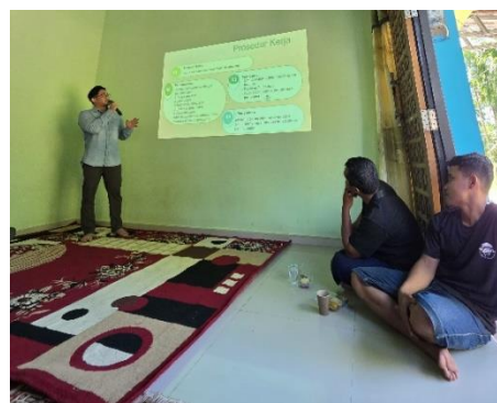
Gambar 2. Penyampaian materi penyuluhan dan sosialisasi.

Bahan utama pembuatan bokashi jawaban peserta pada pre test dan post test sudah benar semua yaitu dengan menjawab limbah bulu ayam broiler. Hasil ini menunjukkan peningkatan pemahaman peserta terkait fokus topik, yaitu pemanfaatan limbah bulu ayam sebagai bahan utama bokashi. Hal ini sejalan dengan penelitian Yuliani dan Hartati (2025) yang menyebutkan bahwa limbah bulu ayam berpotensi besar sebagai bahan baku pupuk organik bokashi.