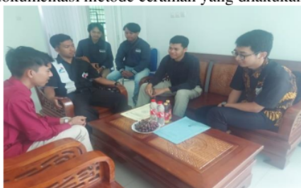
Gambar 1. Ceramah Siklus dan Metode Akuntansi

Proses pendampingan dilakukan dengan dua metode, yaitu: ceramah dan pendampingan secara langsung. Metode ceramah dilakukan untuk menjelaskan siklus akuntansi dan metode akuntansi yang digunakan. Berikut dokumentasi metode ceramah yang dilakukan.