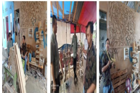
Gambar 7. UMKM Pelopor Handcraft Kerajinan Kayu