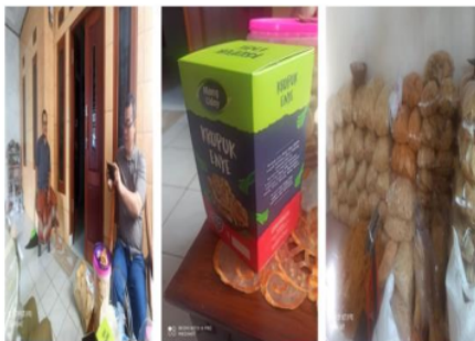
Gambar 4. UMKM Pelopor Krupuk Enye Mang Uday

Gambar di atas menjelaskan bahwa praktik matching business adalah kesepakatan antara UMKM Pelopor dan UMKM Binaan, untuk meningkatkan produksi dalam rangka memenuhi kebutuhan pasar. Berikut ini adalah UMKM Pelopor yang dipilih: