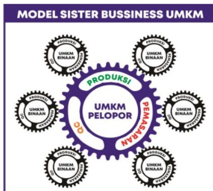
Gambar 1. Model Sister Business UMKM

produksi dan inovasi. Pada aspek finansial yaitu keterbatasan dana yang dimiliki oleh pelaku usaha untuk memproduksi secara terus menerus, dari aspek manajemen UMKM belum memiliki sistem manajemen yang kuat. Aspek produksi yaitu kemampuan dalam memenuhi kebutuhan pasar dan aspek inovasi yaitu kemampuan pelaku usaha untuk berinovasi dalam produk, sehingga pelaku UMKM sangat membutuhkan dorongan dari berbagai pihak. Permasalahan yang dihadapi oleh pelaku UMKM harus diatasi oleh Pemerintah Pusat dan Pemerintah Daerah dengan membentuk suatu model bisnis yang dapat menggambarkan, mengklasifikasikan, peluang bisnis dan strategi pemenuhan kebutuhan pasar (Brillinger et al., 2020; Cosenz & Bivona, 2021; Palmié et al., 2021). Dalam rangka mengatasi permasalahan tersebut diperlukan suatu model pembinaan UMKM, yaitu model yang dapat menunjang kegiatan UMKM atau inovasi model bisnis (Ayu, 2021; Cao et al., 2018; Siebold, 2021; Solihah et al., 2016). Salah satu inovasi dari model ini adalah dengan melakukan best practice yaitu membentuk UMKM yang sudah sukses (UMKM Pelopor) untuk dapat membina UMKM kecil agar mampu berjalan yang disebut dengan model Sister Business UMKM, dapat dilihat pada gambar di bawah ini: