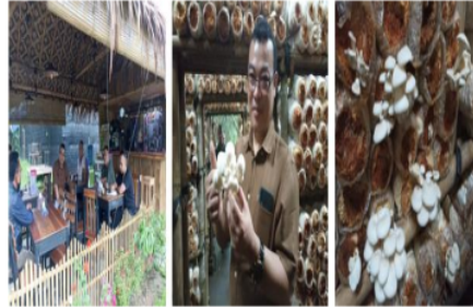
Gambar 5. UMKM Pelopor Budidaya Jamur