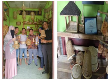
Gambar 6. UMKM Pelopor Handcraft Kerajinan Bambu