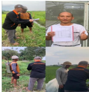
Gambar 3 Sosialisasi dan Pelatihan Tabel Data Usahatani Sederhana

Sebagaimana usahatani yang dilakukan masing-masing peserta pelatihan, Tim mendatangi mereka satu per satu di kediaman atau lokasi usaha masing-masing. Para peserta tampak antusias dan tekun mengikuti pelatihan diselingi dengan pertanyaan-pertanyaan di tengah pelatihan. Tim mendatangi peserta tidak hanya di rumah, tetapi juga di sawah, kandang ternak, dan kolam peternakan ikan mereka (Gambar 3).