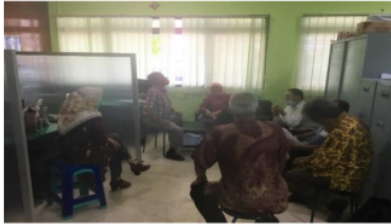
Gambar 1 Koordinasi Tim PKM dengan perangkat kelurahan setempat

petani mitra. Ketua kegiatan dan 3 anggota berangkat ke Kantor Kelurahan Blabak untuk menyampaikan tujuan kegiatan dan memohon izin pelaksanaan kegiatan. Kegiatan disambut baik oleh perangkat kelurahan setempat (Gambar 1).