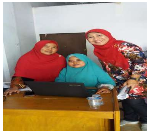
Gambar 1. Penyusunan Laporan Keuangan berbasis EFA

Kegiatan Pengabdian ini bersifat terjadwal. Kegiatan dilaksanakan selama 3 bulan. Kegiatan dimulai dari bulan Oktober 2018 sd. Desember 2018. Kegiatan dilaksanakan secara rutin dalam persiapan penyusunan laporan keuangan berbasis Excel For Accounting.