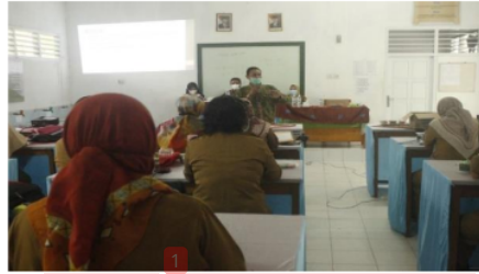
Gambar 4. Pemaparan materi oleh tim pelaksana dengan tanya jawab

Setelah pelaksanaan kegiatan pengabdian selesai dilaksanakan kemudian diberikan kuisioner untuk mengetahui kepuasan dan peningkatan pengetahuan peserta tentang penulisan karya ilmiah dan menghasilkan data sebagai berikut;