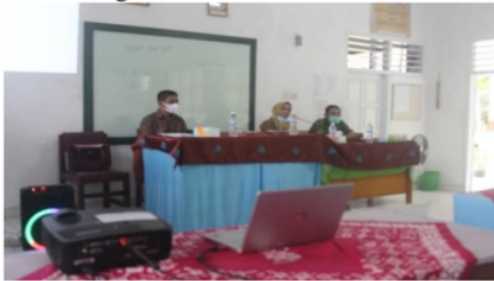
Gambar 1. Pembukaan dan pengarahan oleh Ibu Kepala Sekolah

Muaro Jambi. Kegiatan dilakukan pada hari Senin tanggal 13 September 2021. Kegiatan pengabdian ini dihadiri sebanyak 16 orang guru SMA 3 Muaro Jambi. Kegiatan diawali dengan pengarahan oleh Ibu Kepala Sekolah dan dilanjutkan dengan paparan materi dari Tim pengabdian kepada masyarakat. Selama pemaparan materi dilaksanakan dilakukan juga tanya jawab yang ditanggapi dengan bersemangat oleh para guru peserta bimbingan penulisan karya ilmiah. Rangkaian kegiatan pelaksanaan pengabdian kepada masyarakat dapat dilihat dari gambar berikut: