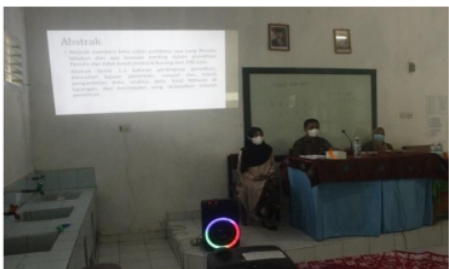
Gambar 3. Pemaparan materi oleh tim pelaksana