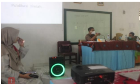
Gambar 2. Kata Sambutan Ketua Tim Pelaksana