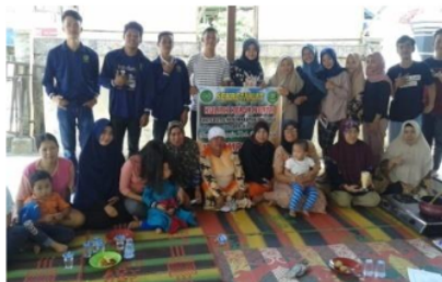
Gambar 5. Bersama masyarakat tani

Tanggal pelaksanaan berdasarkan kesepakatan dengan masyarakat sebagai mitra sasaran yang sebagian besar adalah petani, dimana hampir seluruh waktunya dihabiskan di kebun