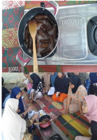
Gambar 6. Pelatihan pembuatan manisanterong

Dari evaluasi pelaksanaan pengabdian kepada masyarakat, diketahui hal-hal positif, seperti di bawah ini :