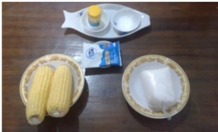
Gambar 1. Bahan-bahan jus jagung manis