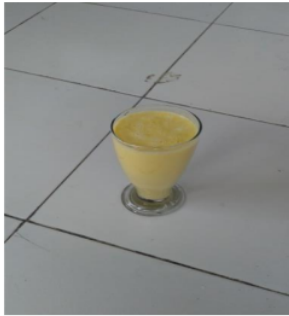
Gambar 7. Jus jagung manis

terong dan jus jagung manis merupakan teknologi sederhana yang mudah diaplikasikan oleh masyarakat sehingga bisa dijadikan modal dasar untuk membuka usaha rumahan (home industri) yang dapat meningkatkan pendapatan keluarga