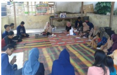
Gambar 4. Kegiatan penyuluhan

Pengabdian masyarakat merupakan salah satu unsur dari Tri Dharma Perguruan tinggi yang harus dipenuhi oleh tenaga pengajar di perguruan tinggi. (Malini et al., 2013), kegiatan pengabdian kepada masyarakat merupakan transfer ilmu dan teknologi sebagai kewajiban yang tertuang dalam Tri Dharma Perguruan Tinggi, yaitu meliputi pendidikan, penelitian dan pengabdian kepada masyarakat. Atas dasar ini tenaga pengajar Fakultas Pertanian Universitas Muhammadiyah Bengkulu berinisiatif melakukan pengabdian masyarakat di Desa Lubuk Penyamun Kecamatan Merigi Kabupaten Kepahiang. Berhubung desa Lubuk Penyamun kaya akan sumberdaya alam, berupa terong dan jagung manis maka materi yang dipilih adalah bagaimana meningkatkan nilai tambah terong dan jagung manis melalui pengolahannya menjadi jus jagung manis dan manisan terong.