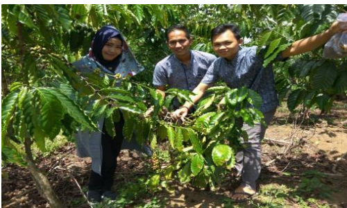
Gambar 1. Perkebunan Kopi Desa Pelangkian

Desa Pelangkian yang terletak di Wilayah Kabupaten Kepahiang terletak pada posisi 101° 55' 19'' sampai dengan 103° 01' 29'' Bujur Timur dan 02° 43' 07'' sampai dengan 03° 46' 48'' Lintang Selatan. Sebagaimana daerah-daerah lain di Indonesia, Kabupaten Kepahiang juga beriklim tropis dengan curah hujan rata-rata 233,5 mm/bulan dengan jumlah bulan kering selama 3 bulan, bulan basah 9 bulan, kelembaban nisbi rata-rata 85,21 persen dan suhu harian rata-rata 23,87°C, dengan suhu maksimal 29,87°C dan suhu minimum 19,65°C. Di Desa pelangkian banyak terdapat perkebunan kopi dan rata-rata masyarakat disana bekerja dan menggantungkan kehidupan dari penghasilan kopi.