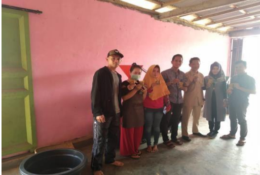
Gambar4 . Tim Pengabdian dan Mitra BumDes Durian Indah

dari Desa Pelangkian. Dan kelompok Tani Kopi Desa Pelangkian belum mendapatkan pembinaan dalam pengembangan usaha.