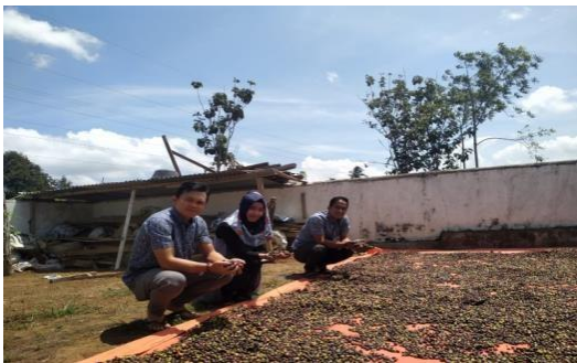
Gambar. 2 Tim Pengabdian

Rapat koordinasi tim pelaksana akan dilaksanakan dengan tujuan dengan agenda pemantapan program dan jadwal kegiatan serta tugas dan fungsi masing-masing anggota tim. Tim pengusul berjumlah 3 orang. Tim mempunyai pengalaman dibidang Manajemen SDM dan Pemasaran.