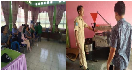
Gambar 1 Koordiasi Tim dan Mitra BumDes Durian Indah