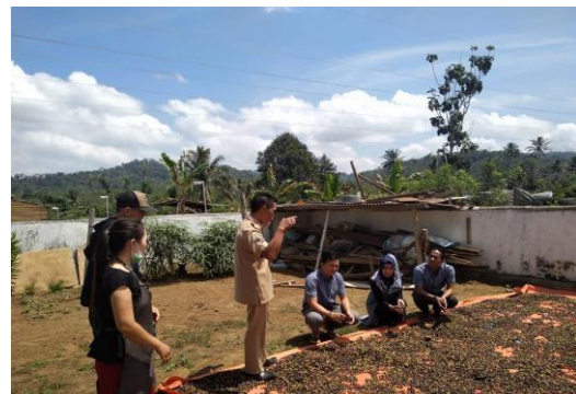
Gambar 3. Tim Pengabdian Melakukan Wawancara

Kegiatan pengabdian Pemberdayaan Ekonomi Lokal Kopi Kitto Melalui Peran Bumdes Durian Indah Desa Pelangkian Kab. Kepahiang ini bertujuan untuk memberikan pendampingan dalam pemberdayaan masyarakat/kelompok tani untuk meningkatkan pengetahuan dan pemahaman tentang manajemen mengelola usaha dengan memilih kemasan serta pemasaran produk yang bernilai saing serta pengembangan produk olahan biji kopi yang dapat memberikan nilai tambah yang lebih besar, sehingga dapat membuka peluang pasar dan menyerap tenaga kerja dalam meningkatkan penghasilan kelompok tani. (Rita et al., 2021)