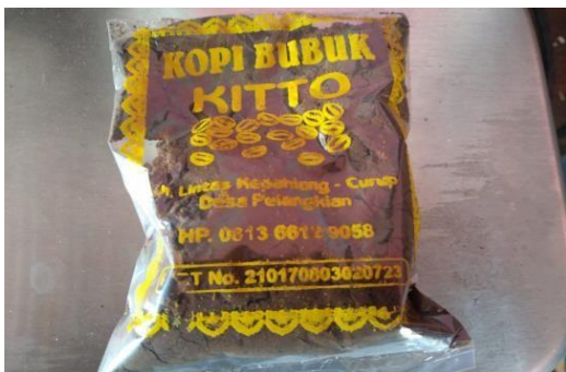
Gambar 4. Kemasan Kopi Kitto Yang Lama

Dalam kegiatan pengabdian ini tim melakukan sosialisasi dan pelatihan. Pelatihan untuk meningkatkan pengetahuan terhadap manajemen mengelola usaha dengan memilih kemasan produk yang lebih menarik dan dapat bertahan lama serta memberikan pelatihan pemasaran produk melalui digital (Khairul Bahrin, Yusmaniarti, 2021).