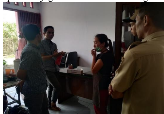
Gambar 5. Sosialisasi Dan Pelatihan Dalam Pemasaran Online

Selain dari kemasan produk yang lebih menarik dan tahan lama kegiatan pengabdian ini juga memberikan pengetahuan dan pemahaman kepada pengelola BumDes dalam meningkatkan penjualan dengan melakukan pemasaran melalui online atau digital. Diharapkan dengan pemasaran melalui online atau digital ini produk dapat berkembang dengan luas dan pendapatan kelompok tani kopi juga semakin meningkat.