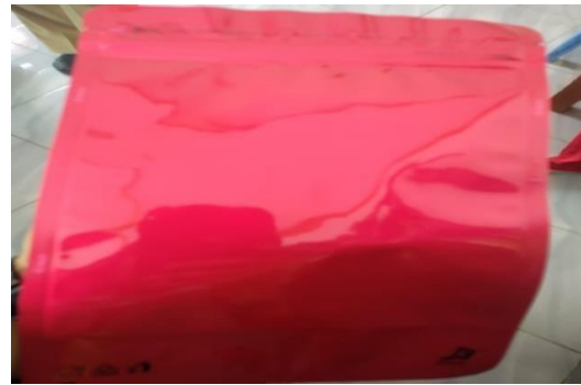
Gambar 5. Kemasan Terbaru

Dari gambar di atas dapat terlihat kemasan Kopi Kitto hanya terbungkus dari plastik sehingga kadar air kopi bubuk masih tinggi yang dapat menyebabkan kopi cepat mengalami kerusakan akibat mikroorganisme yang mudah berkembang. Dengan kegiatan pengabdian ini tim pengabdian memberikan pelatihan dan pengetahuan mengenai kemasan kopi yang dapat membuat produk bertahan lama dengan kemasan yang lebih menarik.