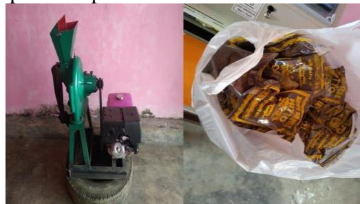
Gambar 2. Mesin Penggiling Kopi dan Kemasan Produk

Hal ini disebabkan oleh kurangnya pengetahuan masyarakat mengenai pengolahan biji kopi pasca panen, kualitas bubuk kopi yang masih rendah karena proses produksi bubuk kopi yang digunakan masih sederhana, kemasan kopi bubuk masih menggunakan plastik sehingga kadar air kopi bubuk masih tinggi akibatnya mikroorganisme mudah berkembang yang menyebabkan kopi mengalami kerusakan, selain itu kurangnya promosi untuk kopi bubuk dari desa tersebut semakin menambah persoalan bagi petani kopi di desa tersebut.