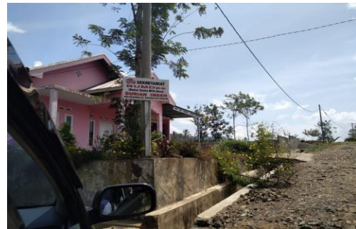
Gambar 3. Bumdes Durian Indah

Badan Usaha Milik Desa (BUMDes) menjadi wadah bagi pemerintah desa dan warganya yang secara proporsional melaksanakan program pemberdayaan perekonomian di tingkat desa. Desa ini dapat menjadikan tanaman kopi sebagai sumber mata pencaharian mereka, dengan meningkatkan produksi kopi dari biji kopi menjadi produk kopi bubuk yang bercitarasa khas sendiri dapat meningkatkan pendapatan masyarakat/kelompok tani kopi di Desa Pelangkian.