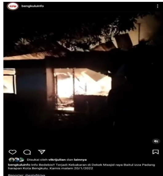
( Gambar 3. Laporan warga terkait Kebakaran di dekat Masjid Raya Baitul Izzah (20/01/22)

Saat ini total postingan berita yang dimuat pada akun @Bengkuluinfo 11, 1 Ribu postingan . Berita yang diposting pun beragam mulai dari berita nasional hingga berita lokal. Tujuan adanya akun ini yaitu untuk memberi informasi kepada masyarakat karena seperti yang kita ketahui bahwa pada saat ini instagram merupakan media sosial yang paling banyak digemari oleh masyarakat dari anak-anak muda hingga dewasa bahkan tidak terlepas dari kehidupan masyarakat maka engan adanya akun ini masyarakat dapat dengan mudah mendapatkan informasi yang teraktual. Berikut postingan dari akun @Bengkuluinfo :