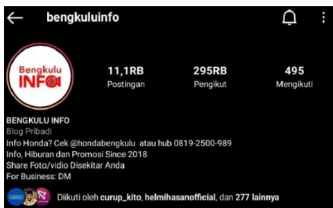
(Gambar 1. Akun Instagram @Bengkuluinfo)

Akun Instagram @Bengkuluinfo merupakan akun instagram yang dikelola oleh salah satu masyarakat di Kota Bengkulu. Akun ini mulai beroperasi dari empat tahun yang lalu yaitu sejak tahun 2018. Hingga saat ini akun tersebut telah memiliki 295Ribu followers yang berasal dari berbagai daerah. Akun @Bengkuluinfo ini merupakan salah satu media independen yang dipercayai oleh masyarakat di berbagai daerah di Bengkulu salah satu nya yaitu di Kota Bengkulu.