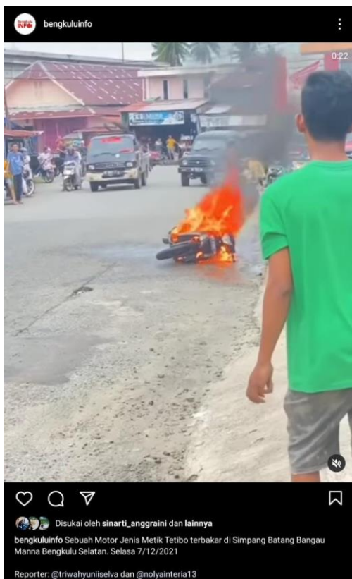
(Gambar 5. Laporan warga terkait motor yang terbakar di parkiran)

video yang dibagikan oleh salah satu warga di daerah Manna. Di video tersebut salah satu warga membagikan informasi kepada masyarakat bahwa ada satu motor matic yang terparkir didepan konter tiba-tiba terbakar. Kejadian tersebut terletak di daerah Manna tepatnya di jalan Simpang Batang Bangau Bengkulu Selatan. Dengan ciri khas kata yang diucapkan oleh citizen journalism yaitu “Min-Min... ada kebakaran motor min di dekat konter Manna, Selasa, (7/12/21)”