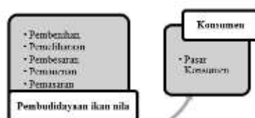
Gambar 3. Pola Rantai Pasok 3

Berdasarkan Gambar di atas menunjukkan pola rantai pasok ikan nila yang ada di Kecamatan Purwodadi Kabupaten Musi Rawas. Pola rantai pasok ikan nila yang terjadi melibatkan berbagai pihak yang mendukung dalam kegiatan yaitu pembudidaya ikan nila, pedagang besar, pedagang pengecer baru ke konsumen. Pada masing-masing lembaga terdapat beberapa aktifitas dalam menunjang kegiatan rantai pasok ikan nila ini. Pembudidaya ikan nila di Kecamatan Purwodadi terdiri dari pembudidaya besar dan pembudidaya kecil. Pelaku utama dalam rantai pasok ikan adalah pembudidaya ikan nila, karena mereka memiliki tahapan kegiatan yang rumit seperti Mulai dari pembenihan, pemeliharaan, pembesaran, pemanenan dan pemasaran. Menurut Hasan, et al (2020) menyatakan bahwa sebelum melakukan kegiatan budidaya ikan, langkah pertama yang harus diperhatikan dalam persiapan budidaya adalah pengelolaan tanah dan air. Pengelolaan tanah bertujuan untuk menciptakan kondisi optimum tanah agar dapat menyediakan lingkungan yang layak sebagai tempat hidup ikan, sedangkan tujuan pengelolaan air bertujuan untuk mempercepat proses