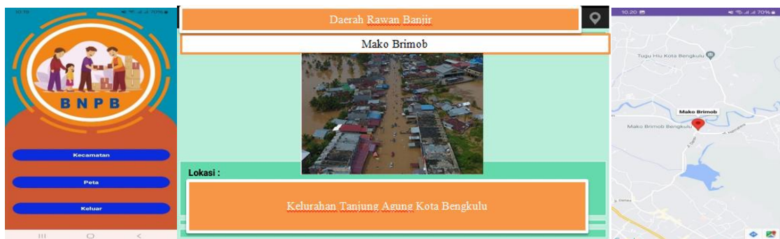
Gambar 2. Hasil implementasi

Berdasarkan tahapan penelitian yang telah dilakukan, diperoleh sebuah Sistem Informasi Pemetaan dan Pemantauan Daerah Rawan Banjir di Bengkulu berbasis WebGIS yang mampu menyajikan informasi lokasi rawan banjir secara visual dan interaktif. Sistem dibangun untuk memudahkan masyarakat maupun instansi terkait dalam memperoleh informasi mengenai wilayah yang berpotensi mengalami banjir melalui perangkat bergerak (mobile). Implementasi sistem mengintegrasikan data spasial hasil analisis metode Overlay dengan antarmuka yang sederhana sehingga informasi dapat diakses secara cepat.