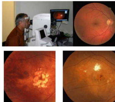
Gambar 2 Contoh Dataset Citra

Tahap pertama adalah data preparation yang dilakukan dengan cara melakukan resize ukuran dataset untuk mempercepat komputasi. Kemudian memisahkan data training dan data testing dengan presentase 70% data training , dan 30% data testing serta mengubah data dan label kedalam format HDF5.