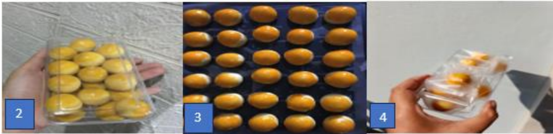
Gambar 2, 3 dan 4. Kemasan Nastar Proses pembuatan dan inovasi pengemasan nastar

Dari kondisi pada gambar 2, ini menunjukkan diperlukannya pendampingan standarisasi proses dan inovasi kemasan, dan berikut ini merupakan kegiatan pendampingan yang dilakukan: