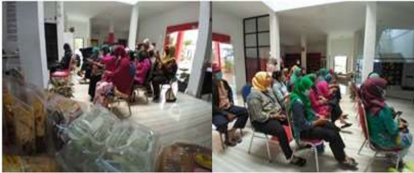
Gambar 1. Suasana pendampingan pelatihan pemasaran melalui shoppe

tokopedia dalam kegiatan ini didominasi ibu-ibu pelaku usaha dari kuliner. Seperti gambar 1.