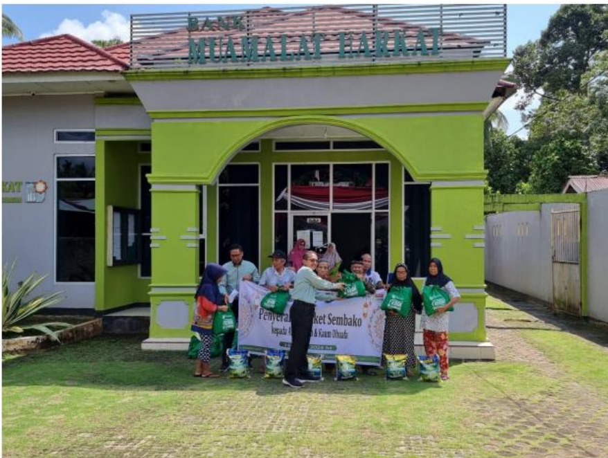
Gambar 1: Foto kegiatan pendistribuisan daan CSR tahun 2024

Setiap tahun BPRS Muamalat Harkat berhasil memcadangkan atau membukukan dana CSR yang berasal dari bagian Laba tahunan , berdasarkan hasil Rapat Umum Pemegang saham (RUPS) rata-rata sebesar Rp. 100.000.000,- ( seratus juta rupiah)