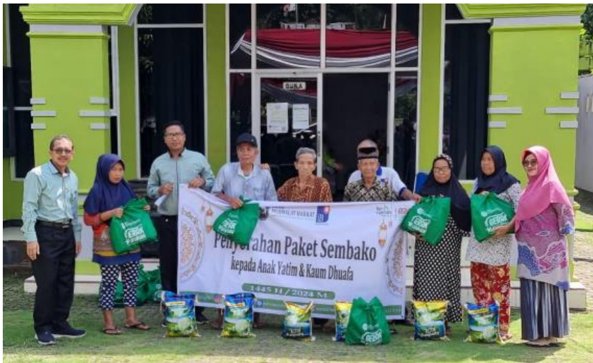
Gambar 2 : pembagiandana CSR BPRS Muamalat Harkat di kecamatan Sukaraja Kabupaten Seluma