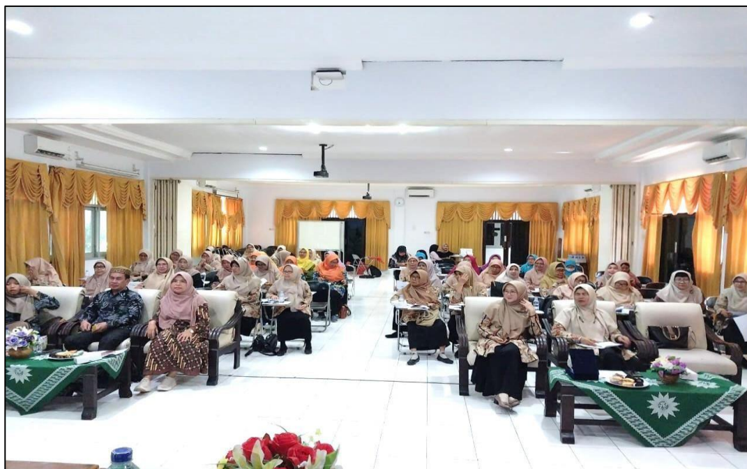
Foto 2 Peserta Sedang Menyimak Materi