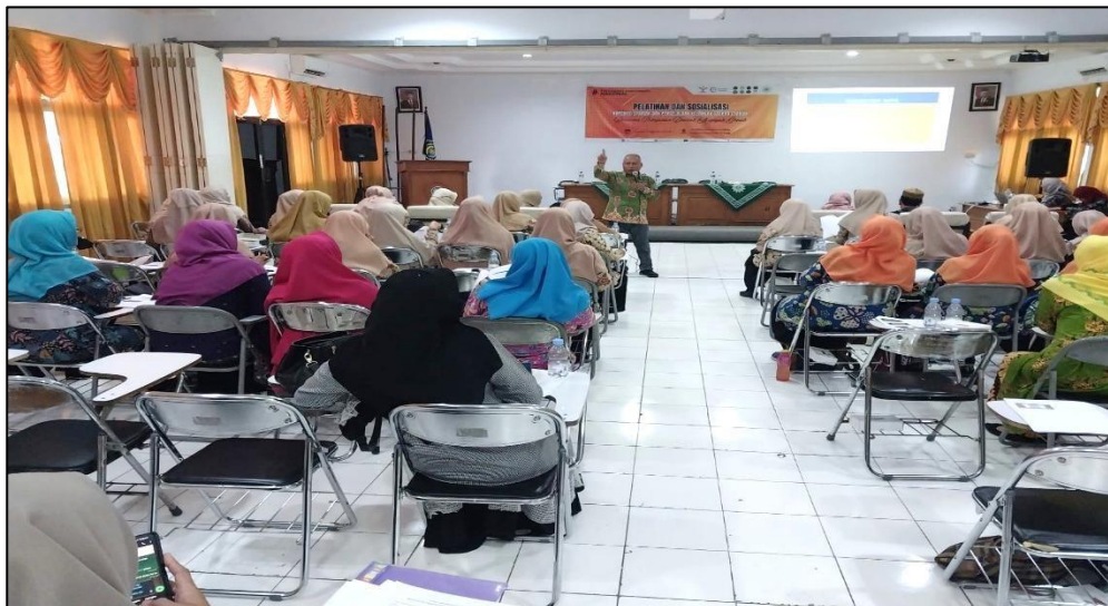
Foto 3 Tim PKM Sedang Menyampaikan Materi Tentang Koperasi Syariah