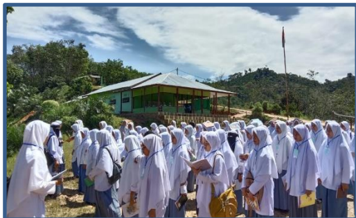
Gambar 7. Peserta Melaksanakan Penugasan Siang

Selanjutnya, tim pengabdian menjelaskan bahwa kata moderat sering disalahpahami dalam praktiknya. Orang yang moderat dipahami tidak konsisten terhadap apa yang diyakininya. Lebih lanjut, bahwa orang yang moderat dipahami tidak konsisten dalam mengamalkan ajaran agama. Jadi, seolah-olah Sebagian masyarakat memahami bahwa orang yang moderat dipahami sebuah bentuk kompromi terhadap keyakinan yang lain (Ismail et al., 2021).