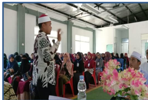
Gambar 5. Peserta Menyimak Materi yang Disampaikan

Masih dalam Bahasa Arab, bahwa kata wasathiyah menjadi jargon yang sangat sesuai dengan kata moderasi. Dalam Alqur'an digambarkan bahwa umat Islam sebagai umat wasath atau umat yang sangat moderat dalam berperilaku. Dimana disatu sisi harus menyuruh orang untuk melakukan kebaikan dan pada sisi yang lain harus mencegah orang untuk berbuat kemungkaran. Pelaku kebaikan dan pelaku kemungkaran merupakan dua hal yang saling bertolak belakang, namun umat Islam harus berada ditengah, dia sebagai orang yang menyeru kepada kebaikan, dia pula sebagai pengingat untuk meninggalkan kemungkaran.