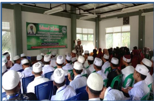
Gambar 4. Peserta Menyimak Materi yang Disampaikan

Sementara itu, kata moderasi dalam Bahasa Inggris diungkapkan dengan moderation . Kata tersebut sangat familiar digunakan dalam ungkapan makna non-aligned artinya tidak berpihak. Jadi secara umum kata moderat dapat difahami tidak berpihak pada salah satu dari dua hal, bahkan mengedepankan keseimbangan dalam memperlakukan orang lain terkait keyakinannya dan lainnya.