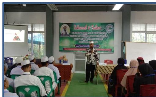
Gambar 3. Narasumber Memberikan Materi Penguatan

Pada kegiatan ini, tim pengabdian menjelaskan materi tentang moderasi beragama kepada peserta dengan sejumlah metode. mulai dari metode ceramah, diskusi, tanya jawab, penugasan dan game.