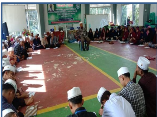
Gambar 1. Peserta Melakukan Pre-Test Terkait Moderasi Beragama

Dalam pelaksanaannya semua peserta dibuat duduk dengan bentuk melingkar, selanjutnya masing-masing peserta mengisi jawaban dari pertanyaan pada selembar kertas yang telah disiapkan oleh tim pengabdian.