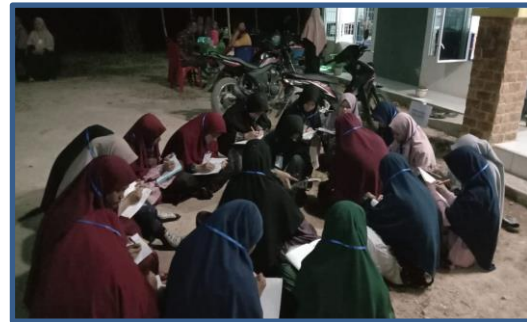
Gambar 8. Peserta Melaksanakan Penugasan Malam

sikap yang seimbang antara praktik pengamalan agama sendiri dan penghormatan kepada praktik agama orang lain. Oleh karena itu, bentuk paham berimbang atau wasathiyah dalam beragama akan menuntun sikap yang tidak ekstrim kanan atau ekstrim kiri. Paham moderat menjadi sebuah paham yang menjaga keharmonisan antara dua paham ekstrim.