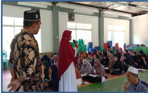
Gambar 6. Peserta Melakukan Diskusi dan Tanya jawab

Selanjutnya, tim pengabdian menjelaskan bahwa kata moderat sering disalahpahami dalam praktiknya. Orang yang moderat dipahami tidak konsisten terhadap apa yang diyakininya. Lebih lanjut, bahwa orang yang moderat dipahami tidak konsisten dalam mengamalkan ajaran agama. Jadi, seolah-olah Sebagian masyarakat memahami bahwa orang yang moderat dipahami sebuah bentuk kompromi terhadap keyakinan yang lain (Ismail et al., 2021).