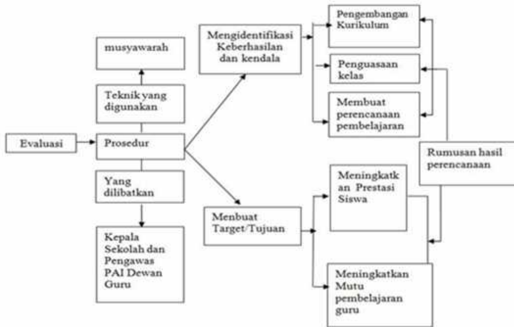
Bagan 3. Proses Evaluasi supervisi akademik di SD N 78 Kota Bengkulu