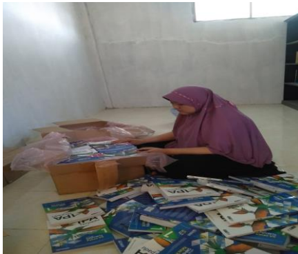
Gambar 2 : penghitungan, pemberian stempel,sekaligus pemberian no pada buku