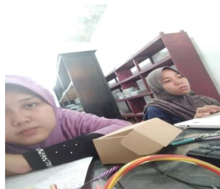
Gambar 1 : merupakan pendampingan pengenalan cara pembuatan pembukuan administrasi perpustakaan secara manual dan terkomputerisasi

Untuk meningkatkan keterampilan pengelola perpustakaan sekolah SMPS TAUTHIAH ARONGAN ini dalam hal pembuatan administrasi perpustakaan maka dipandang perlu melakukan pendampingan. (Setiorini et al., 2020) Kegiatan pendampingan dapat dilihat dari gambar 1