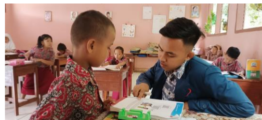
Gambar 6 : Pendampingan khusus

Pendampingan bagi murid yang memiliki keterbatasan berpikir/ lambat belajar, belajarnya akan di pisah dengan teman temannya karena dia perlu perlakuan khusus, sehingga bisa menyamai teman temannya dalam menerima materi pelajaran. ( Laporan Akhir KM3 Rati Lestiani, n.d. )