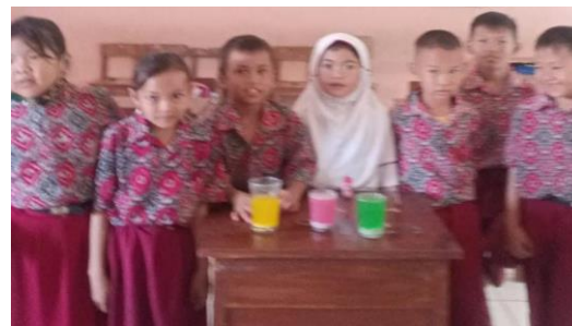
Gambar 9 : Eksperimen Beras Menari

Saya sendiri memiliki sebuah proker yang saya laksanakan di bulan juni yaitu praktek sains eksperimen beras menari pada murid kelas 2, saya Bersama rekan membagi menjadi 3 kelompok dan disana siswanya sangat senang merasa terhibur serta mendapat pengalaman yang menarik lagi. ( Laporan Akhir KM3 Rati Lestiani, n.d. )