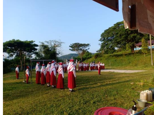
Gambar 5 : Latihan Upacara Setiap Hari Sabtu

akhirnya ada yang pengajari PBB yang mungkin mereka sudah lupa bagaimana. ( Laporan Akhir KM3 Rati Lestiani, n.d. )