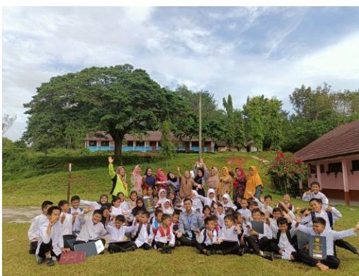
Gambar 11 : Foto Bersama Guru, Staf Tata Usaha, Seluruh Siswa SDN 3 Pulau Pinang

Kami juga sudah mempersiapkan cinderamata untuk di serahkan ke pihak sekolah dan beberapa aksesoris untuk kami berikan kepada murid-murid yang mendapat juara kelas sebagai apresiasi dan kenang-kenangan dari kami peserta Kampus Mengajar. ( Laporan Akhir KM3 Rati Lestiani, n.d. )