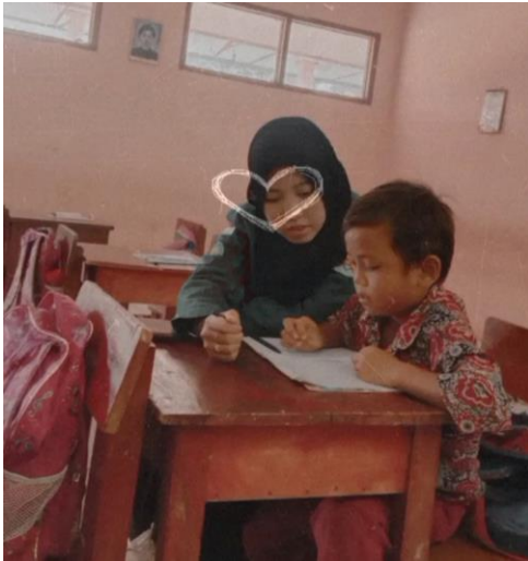
Gambar 3 : Pelatihan khusus siswa yang tertinggal pelajaran

Penyuluhan dan praktek olahraga dari mahasiswa kepada murid guna mengajarkan betapa pentingnya Kesehatan. Kami mengadakan kegiatan senam setiap 2 minggu sekali dan di ikuti oleh para guru. ( Laporan Akhir KM3 Rati Lestiani, n.d. )