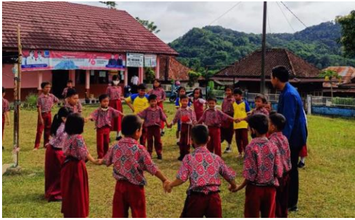
Gambar 10 : Proker Satu Jam Lebih Dekat

Tanggal 24 Juni 2022 pembagian raport dan juga merupakan hari terakhir kami di sekolah itu. Di hari itu kami menyampaikan permintaan maaf dan terimakasih sudah menjadi salah satu bagian dari cerita kami, saat itu juga ternyata semua murid sudah menyiapkan surat cinta untuk masing masing dari kami, semuanya terharu dengan momen perpisahan hari itu. ( Laporan Akhir KM3 Rati Lestiani, n.d. )