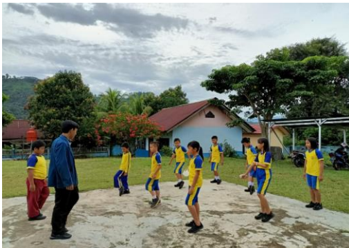
Gambar 4 : Senam sehat

Penyuluhan dan praktek olahraga dari mahasiswa kepada murid guna mengajarkan betapa pentingnya Kesehatan. Kami mengadakan kegiatan senam setiap 2 minggu sekali dan di ikuti oleh para guru. ( Laporan Akhir KM3 Rati Lestiani, n.d. )