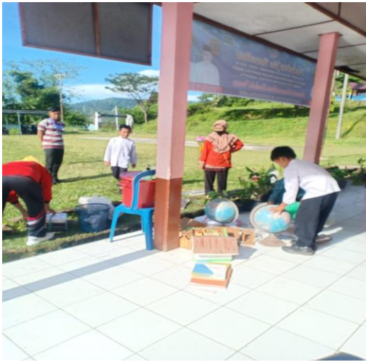
Gambar 7 : Kebersihan Lingkungan

Terkait bantuan teknologi, Teknologi komputasi sekarang sangat mendarah daging dalam kehidupan seperti cara kita mendengarkan musik atau menonton televisi hingga cara kita terhubung dengan orang, tempat, dan informasi. (Widyantoro et al., 2022)