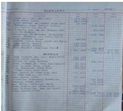
Gambar 7. Laporan keuangan masjid yang masih menggunakan pembukuan sederhana

Dari Edukasi Penyusunan Laporan Keuangan Masjid meningkatkan keterampilan dan pengetahuan terhadap Pengelolaan keuangan, kepada Bendahara masjid Thanbihul Ghofilin Desa Ujung Padang dibidang akuntansi keuangan terutama Laporan Keuangan sehingga mereka Memiliki Skill dan pengetahuan yang baru dan lebih lagi dibidang akuntansi keuangan. Hasil yang dicapai dari program pelatihan penyusunan laporan keuangan untuk pengelolaan keuangan masjid Desa Ujung Padang.